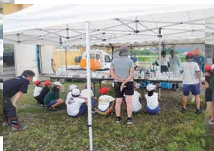
皆で捕まえた魚を確認