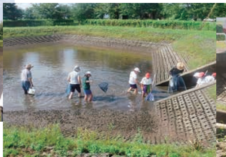
魚の出入口を探します