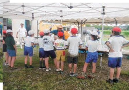
昔と比較して魚の種類が どう変わったのか考えます