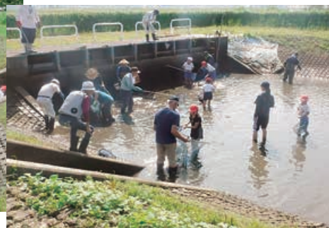
皆で協力して誘いこみます