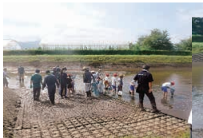
生き物調査スタート

令和7年9月、猿橋川右岸揚水機場にて新組小学校4年生と先生、地域の皆さんで生き物調査が行われました。生き物調査は毎年行われており、地域の生き物の生態系調査を通じ環境や農業に対する興味・関心を持ち、地域環境を守る必要があるのかを考えるきっかけになれば幸いです。