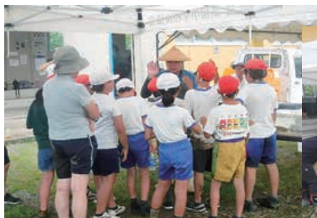
学校で調べてきた事を 振り返ります